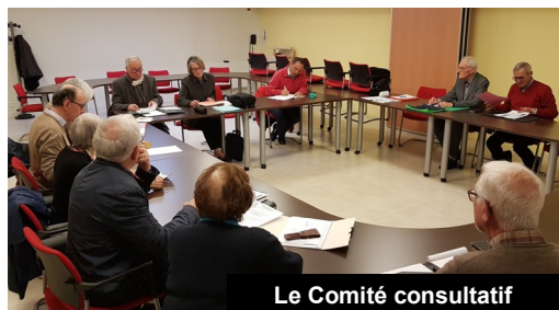
Le Comité consultatif