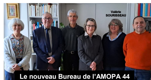
Le nouveau Bureau de l'AMOPA 44