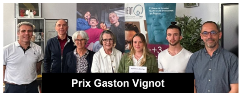
Prix Gaston Vignot

Sortie de printemps dans le Morbihan le 11 avril à Rochefort-en-Terre et au Musée de la Résistance en Bretagne de Saint-Marcel. Déplacement en car de Nantes. Une trentaine d'Amopaliens ont participé à cette sortie. Après un déjeuner convivial à Saint Marcel, visite du musée de la Résistance en Bretagne à Saint-Marcel. Ce fut l'occasion d'évoquer le souvenir du maquis de Saint-Marcel en ce 80e anniversaire de la libération de la Bretagne et d'introduire la visite du Maquis de Saffré prévu 2 mois plus tard.