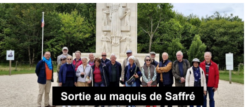
Sortie au maquis de Saffré