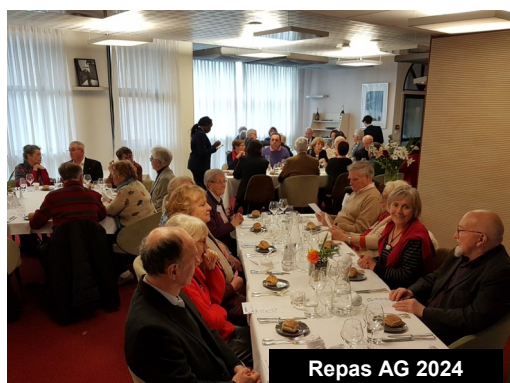
Repas AG 2024