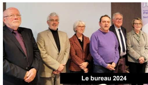
Le bureau 2024