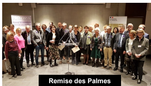
Remise des Palmes