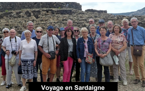
Voyage en Sardaigne

Depuis la mi-décembre, notre section présente un nouveau site internet. Celui-ci bénéficie d'une présentation plus moderne, plus simple et plus aérée et fournit toujours les mêmes informations nécessaires sur la vie de l'association, ses activités passées et ses projets. Le site peut être désormais consultable sur smartphone. Pour effectuer cette modernisation, Sophie LEBRUN et Pascal MONSELLIER ont suivi pendant 6 demi-journées au mois d'octobre, une formation par l'association Mediagraph sur le progiciel WordPress qui héberge maintenant le nouveau site. Cette formation a été financée par la ville de Nantes dans le cadre de son aide aux associations de Loire Atlantique