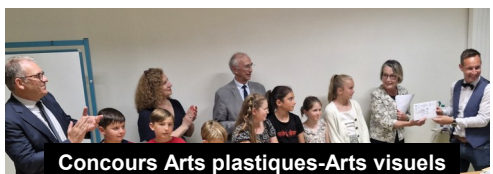
Concours Arts plastiques-Arts visuels

Sortie de printemps dans le Morbihan le 11 avril à Rochefort-en-Terre et au Musée de la Résistance en Bretagne de Saint-Marcel. Déplacement en car de Nantes. Une trentaine d'Amopaliens ont participé à cette sortie. Après un déjeuner convivial à Saint Marcel, visite du musée de la Résistance en Bretagne à Saint-Marcel. Ce fut l'occasion d'évoquer le souvenir du maquis de Saint-Marcel en ce 80e anniversaire de la libération de la Bretagne et d'introduire la visite du Maquis de Saffré prévu 2 mois plus tard.