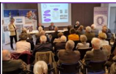
20 mars 2025 – Assemblée Générale de l'AMOPA 44