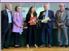
20 mai 2025 – Remise des prix nationaux de l'AMOPA