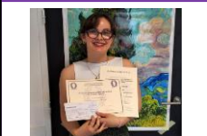
17 juin 2025 – Remise du premier prix national Gaston Vignot à Pontchâteau