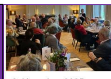
6 décembre 2025 – Déjeuner des Palmes au Château de la Gournerie

Pour tout savoir sur nos événements passés et à venir, les concours et autres actualités de l'AMOPA, rendez-vous sur notre site