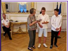
2 juillet 2025 – Remise des prix du Concours de la Résistance