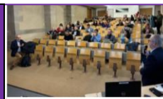
22 novembre 2025 – Rencontre proposée par l'AFAE sur le thème de la santé mentale en milieu scolaire