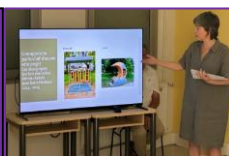
1er juillet 2025 – Conférence de la DRAFPIC