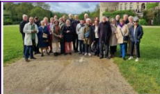
23 avril 2025 – Sortie de printemps en Anjou