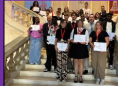
29 septembre 2025 – Remise des prix de l'Apprentissage