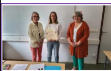
3 juin 2025 – Remise du prix Gaston Vignot à Grafipolis