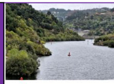
8 au 15 septembre 2025 – Croisière sur le rio Douro